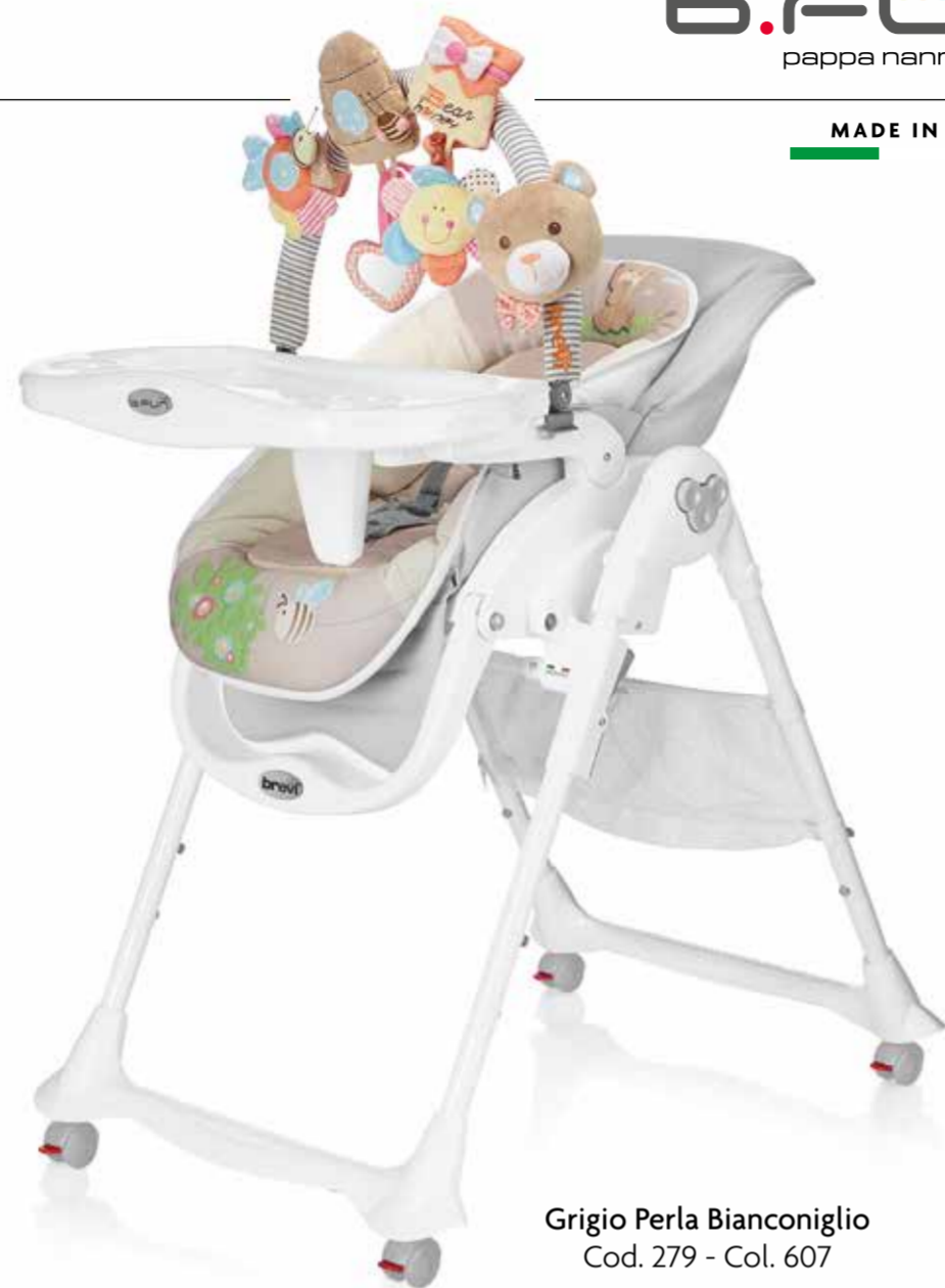
Grigio Perla Bianconiglio Cod. 279 - Col. 607