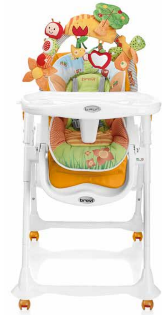
Giallo Girasole Cod. 279 - Col. 644