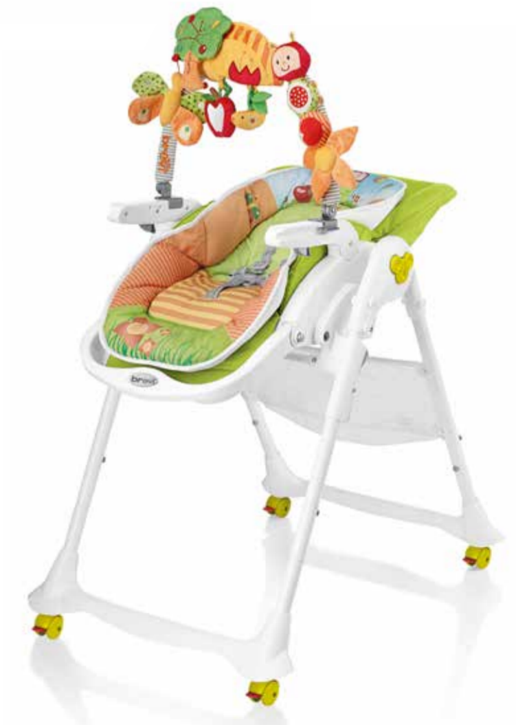
Verde Bambù Cod. 279 - Col. 646