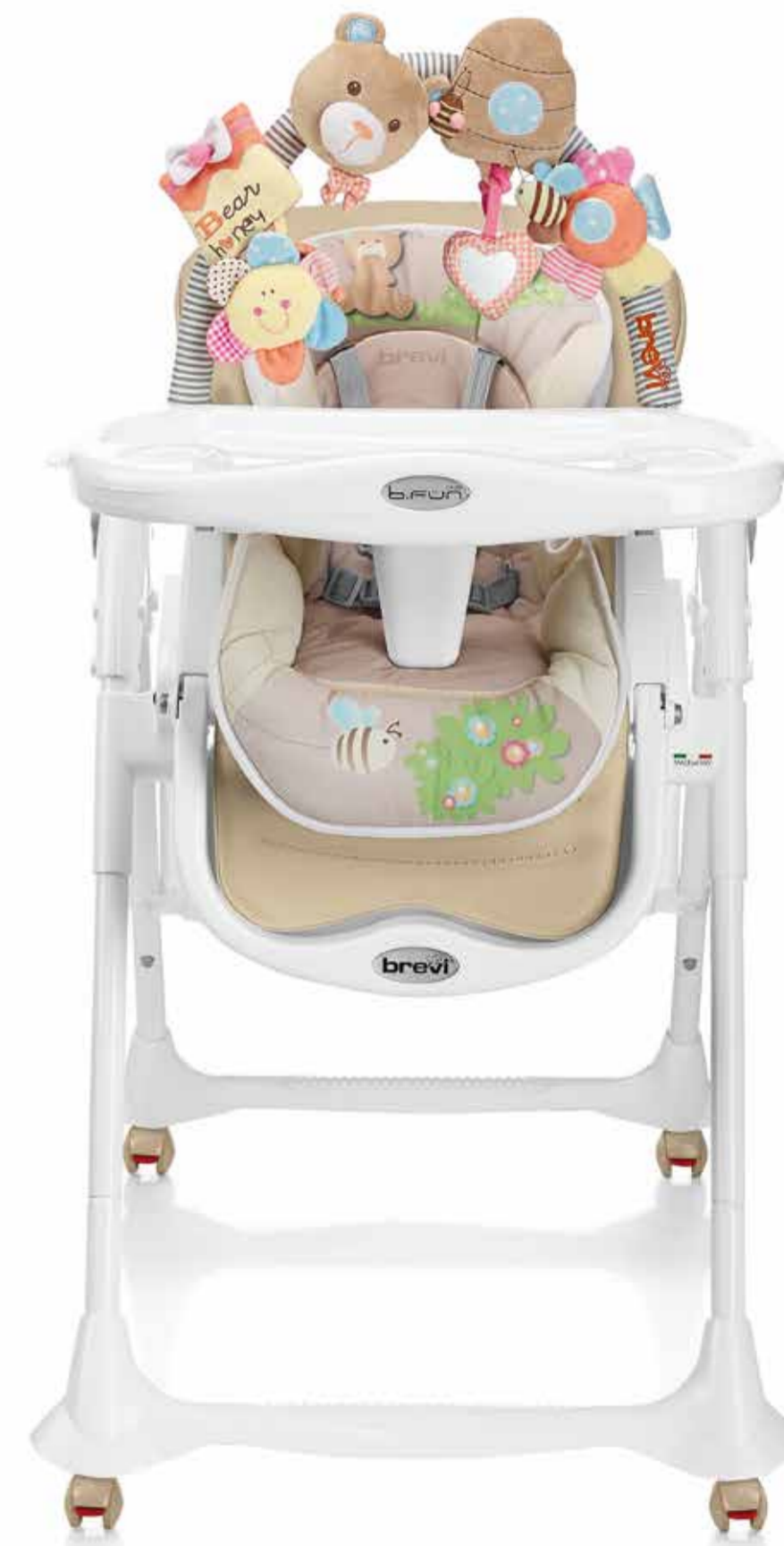
Beige Sabbia Cod. 279 - Col. 642