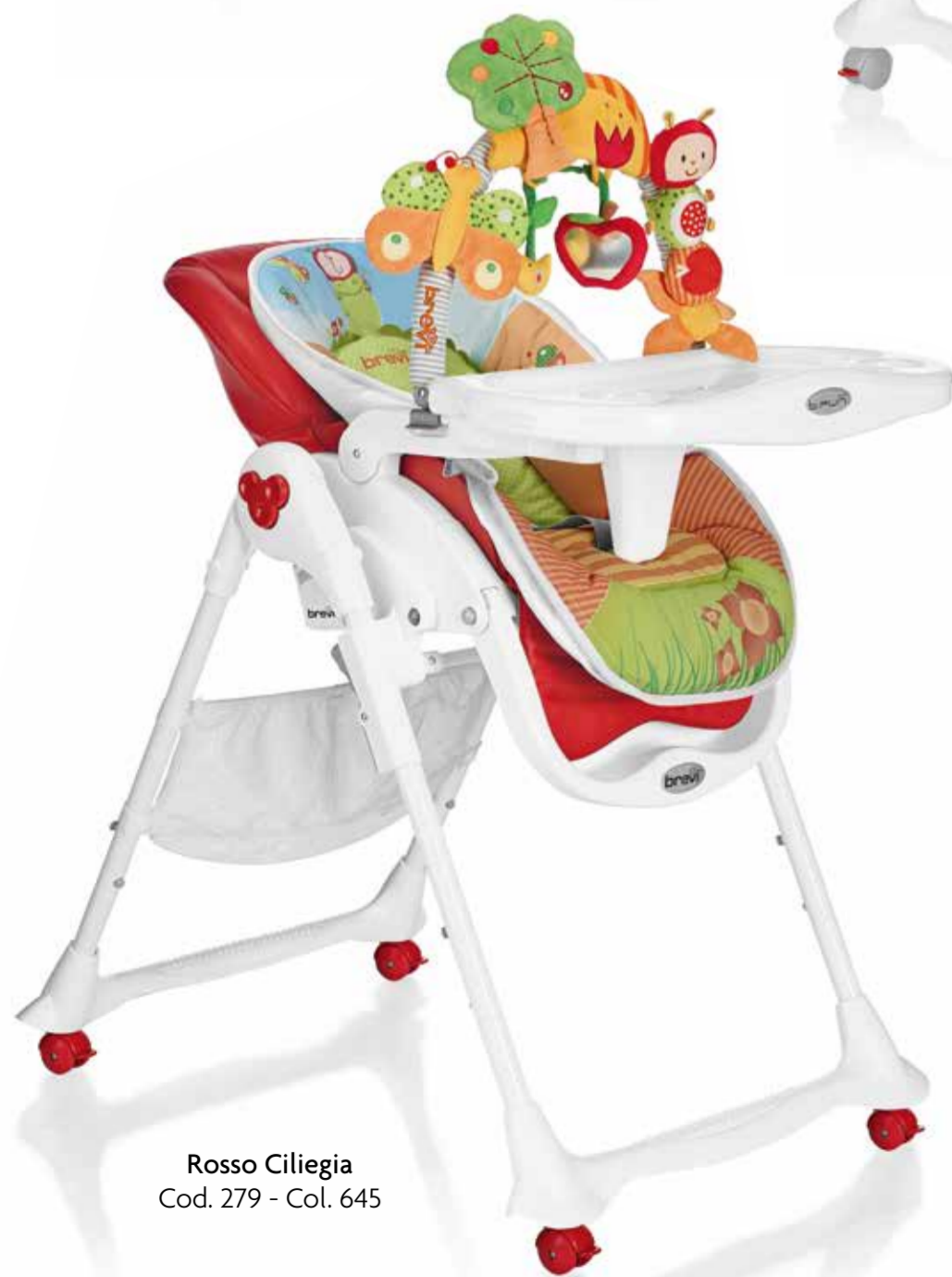
Rosso Ciliegia Cod. 279 - Col. 645