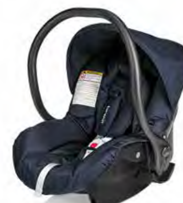
Cod. 545 - Col. 002