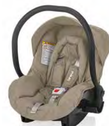
Cod. 545 - Col. 299