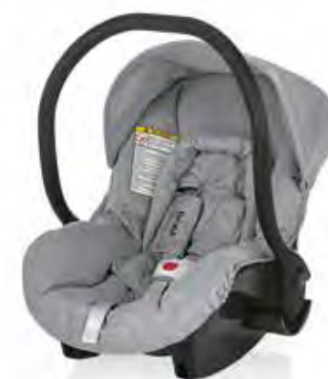
Cod. 545 - Col. 277