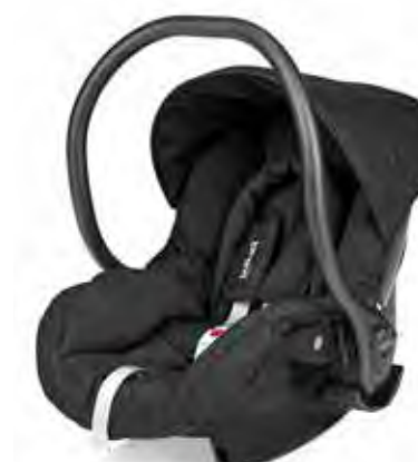
Cod. 545 - Col. 258