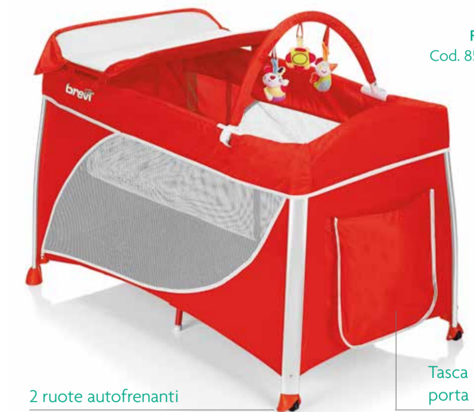
Rosso Cod. 851 - Col. 233