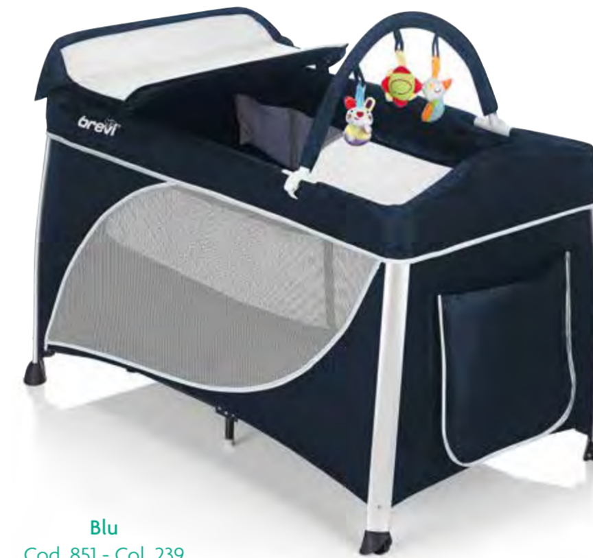
Blu Cod. 851 - Col. 239

Perfetto durante i viaggi con il bebè, ma anche in casa, è adatto dalla nascita fino ai 4 anni circa (15 kg). Il Kit doppia altezza in posizione alta, evita i problemi alla schiena dei genitori ed è utilizzabile dalla nascita ai 6,5 kg (circa 3 mesi) oppure finché il bambino non è in grado di sollevarsi sulle mani o sulle ginocchia. Pratico e super accessoriato è completo di un fasciatoio utilizzabile dalla nascita, arco giochi e tasca laterale porta pigiama, affinché la mamma possa avere tutto a disposizione per un riposo confortevole del suo bambino. E quando il bambino sarà cresciuto, la porta con cerniera potrà essere aperta per permettere al bambino di uscire dal lettino autonomamente consentendo alla mamma di preparare il lettino più agevolmente. Grazie alle due ruote è possibile spostare il lettino con facilità