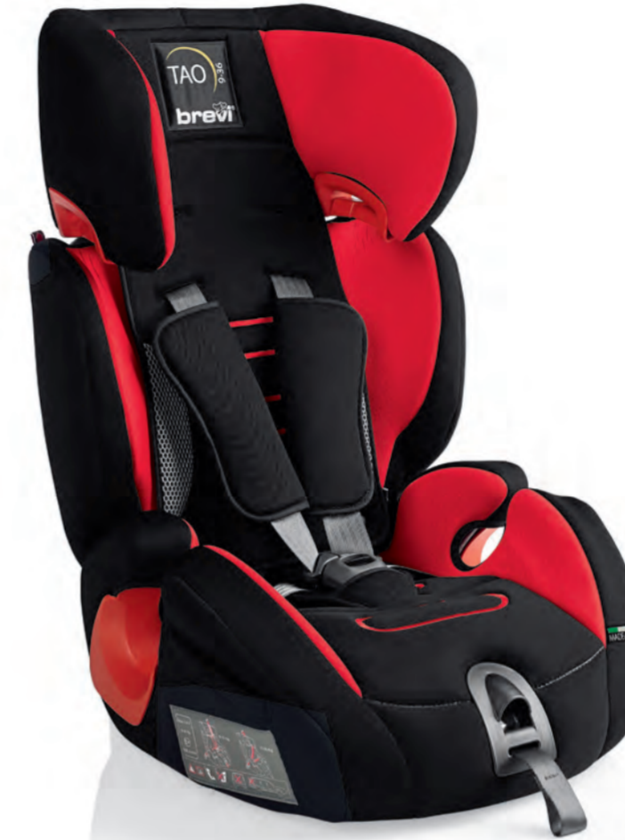
Rosso Cod. 531- Col. 233