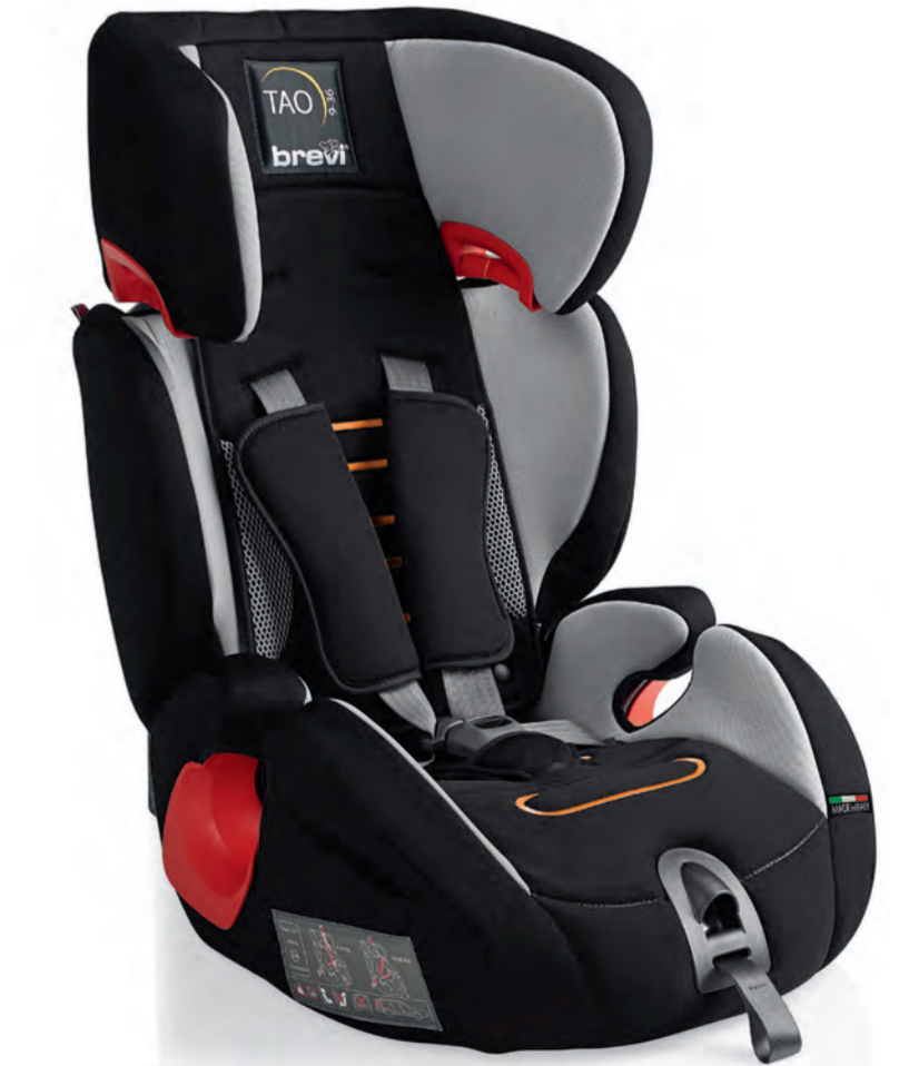
Grigio Cod. 531 - Col. 077