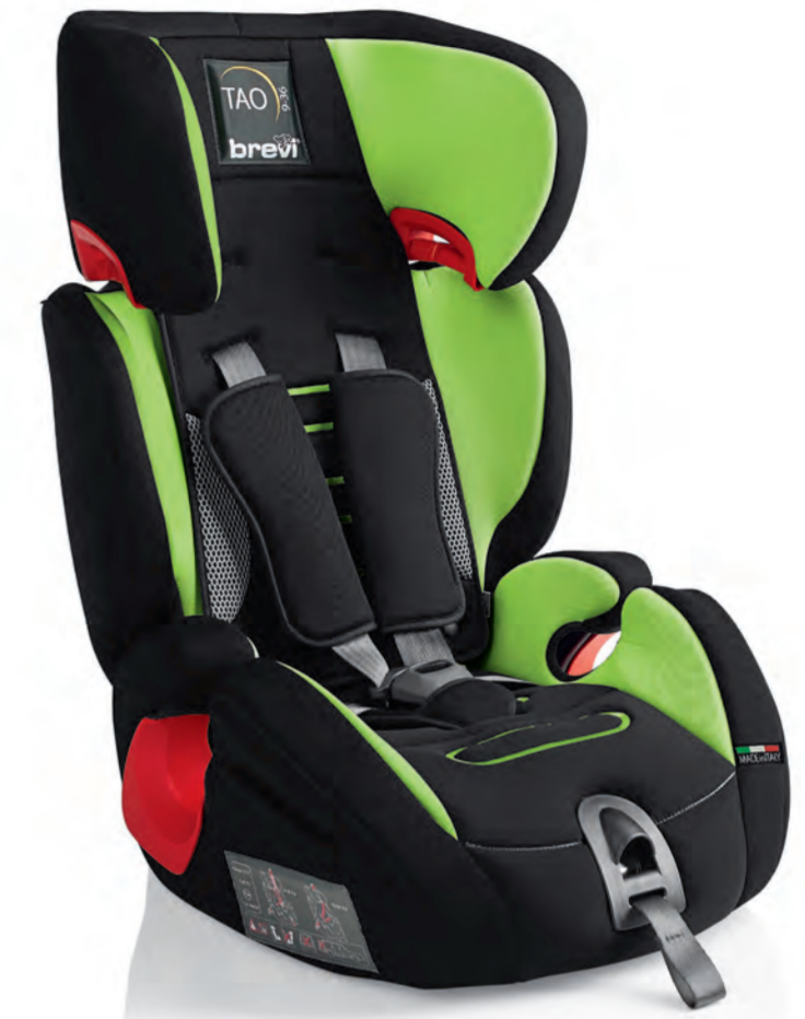
Verde Cod. 531 - Col. 262