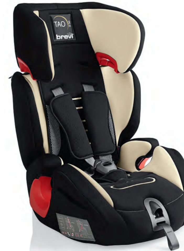
Panna Cod. 531 - Col. 067