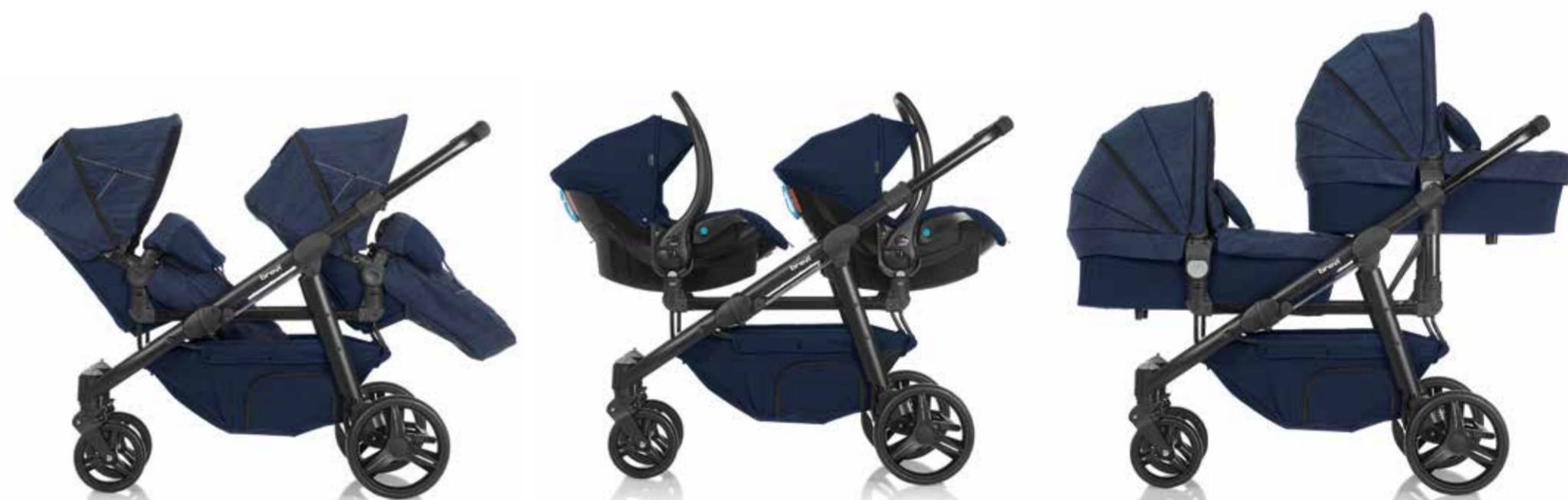
Navy Blue Jeans Passeggino Cod. 781 - Col. 653