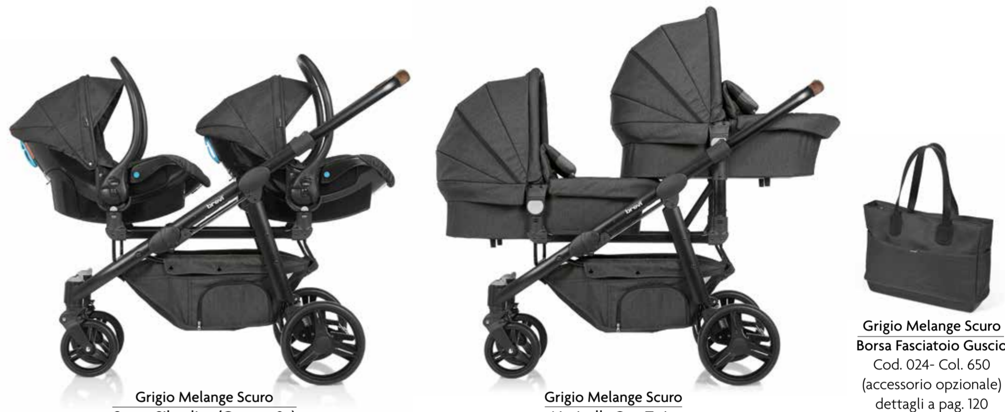
Grigio Melange Scuro Smart Silverline (Gruppo 0+) accessorio opzionale già dotato di adattatori per Ovo Twin Cod. 545 T - Col. 650